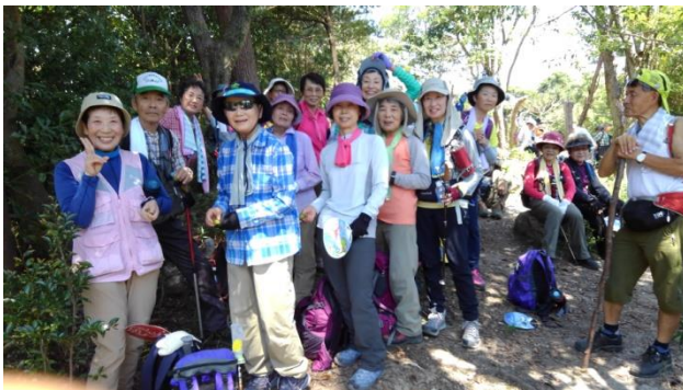
ヒヨコ・レディ隊・・2人のみが邪魔ですね！

阪急御影駅北側深田池に8:30集合。岳連の森づくりの集合場所です。昨日からテント泊の研修で岳連の森で合流するはずのニューサークルメンバーも集まっていたので聞いてみると、