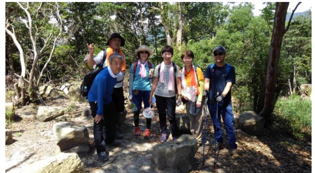
打越山山頂にて/ニューサークルの皆さん（上・下）