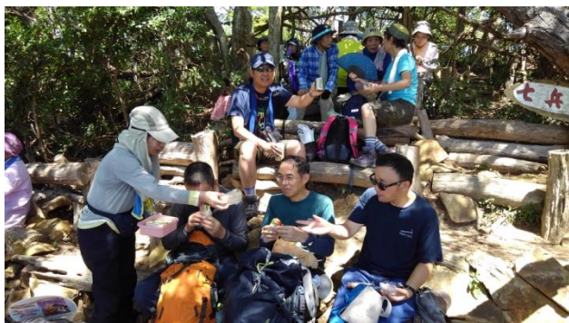
ど〜ぞ、これお食べ! 有難う、お姉さ〜ん!

「少し狭いけど風も通るので、ここで昼食!」 「下山は 金鳥山 へ廻ると、時間がかかりすぎ、熱中症で倒れる人が出たら困るので、ショートカットして、八幡谷から岡本に降ります。」と、大変有難い会長のお言葉です!