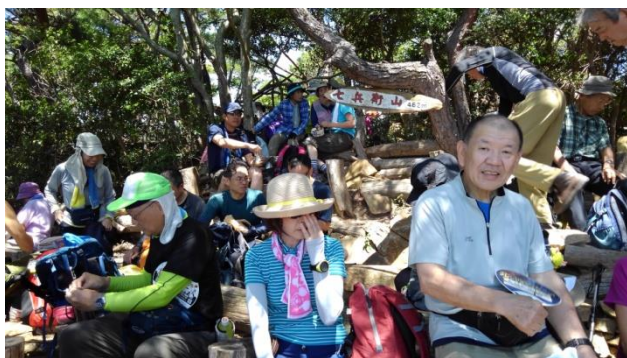
サア〜昼飯だ〜! / 七兵衛山 の展望台にて

次は 七兵衛山 です。一旦、打越峠へ下って、少し東へ進んだ所から右へ入って行くと、見晴らしの良い 七兵衛山 へ飛び出しました。