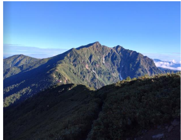
鹿島槍ヶ岳の雄姿

そこから少し歩くと爺ヶ岳付近でコマクサの群落がありました。来る時は雨で見過ごしていました。8:30に種池山荘に到着。ここでコーヒータイム。青空の下でゆっくりと休憩を取りました。