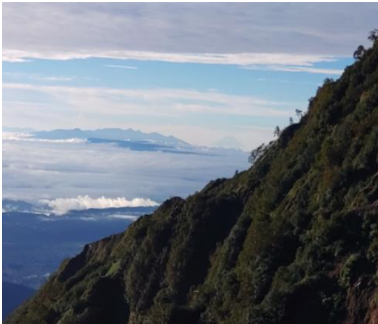
富士山がうっすら見える

最高の天気になりました。1時間程歩いて振り返ると鹿島槍ヶ岳の南峰、北峰の雄姿が見えました。皆一斉に「来てよかった！！」しばらく立ち止まって写真タイムです。