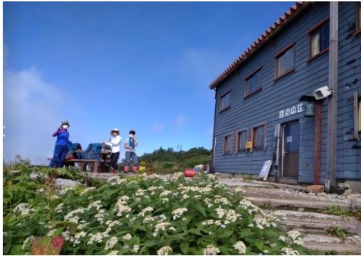
種池山荘のテラス