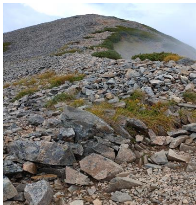
鹿島槍ヶ岳 (ガシタ道)

ジグザグのガシタ道、途中で荷物をまとめてデポし山頂には 11:30 に着きました。お疲れ様のタッチをしました。天気も良くなり、しばらく山頂で景色を楽しみました。北側には今までガスで隠れていた鹿島槍ヶ岳北峰が見え、その向こうには五竜岳の雄姿がありました。記念撮影をし、下山します。冷池山荘に帰る頃にはまた雨が降ってきました。丁度良いときに鹿島槍ヶ岳の山頂に登れてラッキーでした。