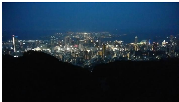
神戸港を望む錨山てんぼうからの夜景

そんな出来事が有り、時間を費やしたのが幸い？して、少しモヤってはいましたが、神戸市街の夜景を堪能？することが出来ました！