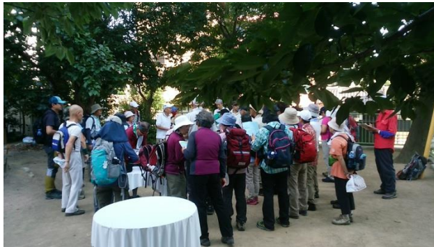
出発前の注意事項に聞き入る参加者

集合場所へ行ってびっくり！・・・何時もは少年野球の子供達がグラウンドで試合をしているぐらいで、公園そのものは広く静かなものですが、この日は1年に1度の「夏まつりの日」。「第8回諏訪山盆踊り」の会場となっている公園は、色々なブースで埋めつくされ、多勢の方が準備で右往左往です！・・・私達はどこ？・・・と探していると、西の端の比較的涼しい場所に集まっておられました。ここ1週間程は猛暑日が続き、今日も大変な暑さで参加者は少ない？・・・と思っていたのですが、後で聞くと42名(内ヒヨコ会員は38名)も参加されていたとのこと！ヒヨコの仲間は本当にお元気だな～とつくづく思いました。