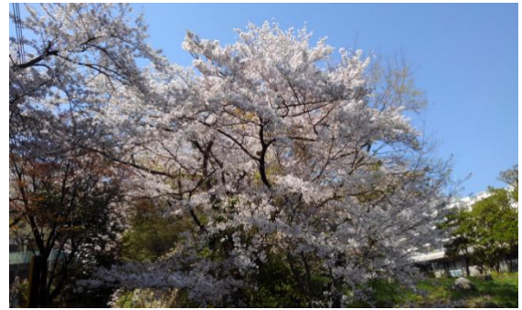
青空をバックに咲く桜。素晴らしい風景です！

花は散り、次は新芽になり、若葉の薄い色は、成長と共に色を変える様子が私はとても大好きです。夏になると暑い日差しの下では木陰を作り私達を又、癒してくれます。