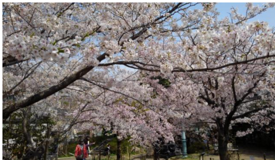
例年よりも見事に咲き誇るさくら♪桜♪！！

憂鬱（ゆううつ）な日々の中、私は日差しの差す暖かい日に、会下山公園を散歩しました。人影はまばらで静かな風景です。・・・でも、わたくしにとって今年の桜の花はとても素晴らしく思えました。