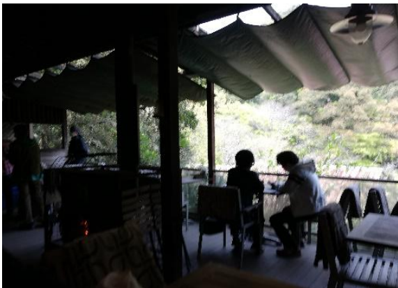
再度山荘オープンテラス席にて

当日は初夏を思わせる好天に恵まれ、AM10:30に三宮で待ち合わせ、生田神社を参拝し、トアロードから諏訪山公園でトイレ休憩。大師道を歩いてほぼ1時間で到着。燈籠茶屋の上にある目的地は再度山荘。12時の開店には30分あり周辺を散策し10分前にオープンエアのテラス席に案内された。