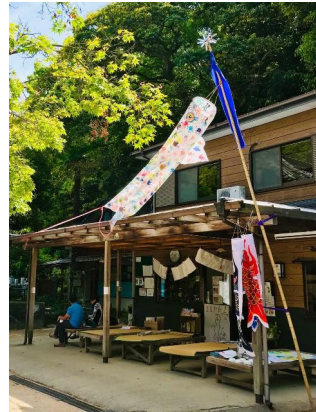
カミカ茶寮とお弁当

しい状況が続く中ではありますが、5/17(日)阪神御影から市バスで渦森台へ、午前10時到着。渦森展望公園の登山口から入り、六甲ケーブル山上方面に登る。寒天山道の分岐から関電巡視路を、高羽道方面に進む。途中油コブシから六甲山を目指す女性2名が道に迷ったと。油コブシ分岐を見落とししたようで分岐迄案内し、我々は六甲ケーブル方面に進み、鶴甲から十善寺を目指した。