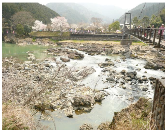
篠山川を跨いでいる吊橋と川代公園

篠山を後にして、この日の目的「春の宴・昼食懇親会」会場へ移動です。会場は川代公園という広大な名勝地で、地元の皆さんが親しんでおられる場所でした。ここもさくら祭りが催されており、