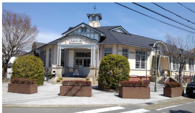
素敵な建造物・大正ロマン館（旧篠山市役所）

あっという間に散策時間が過ぎ、駐車場へ。このころになると、駐車場もほぼ満車で、計画の組み立てが良かったことに感心しました。