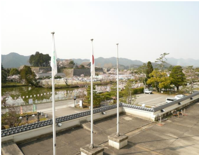
篠山市役所の市長室から眺める篠山城跡の景観

新神戸を7時30分出発。ヒヨコ会員、みはらし会員、そして会員の友人合わせて42名の参加です。当日は篠山市が毎年行っている「桜まつり」の日。大変な混雑が予想されるということで篠山城跡の駐車場へは大型バスでは一番乗りでした。何よりも篠山市長の粋な計らい？で開放して頂いている「市長室」から眺める城跡の風景は、お堀端を彩る桜の木々が美しさを際立たせ、この季節訪れたことが無い私にとって大変感動しました。