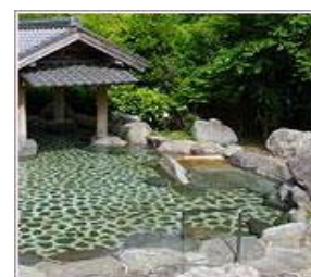
今田薬師温泉・ぬくもりの郷（同 HP より）

あっという間の1日でしたが、山歩きとは違った楽しさに、時間が過ぎるのが早く感じたツアーでした。山々に囲まれた丹波・篠山は、皆さんの共通した「ふるさと」のように感じた1日でした。