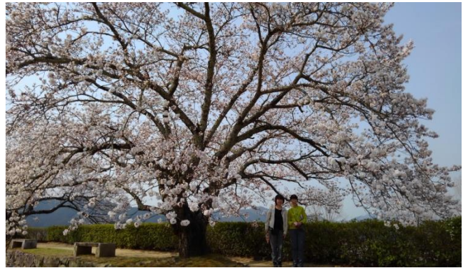
城壁跡に咲くみごとな桜の下で・・・

の時間は、先ず城跡巡りに行きました。内堀の手前には開花宣言の基準になる桜木があり、この桜木はさすがに満開でした。