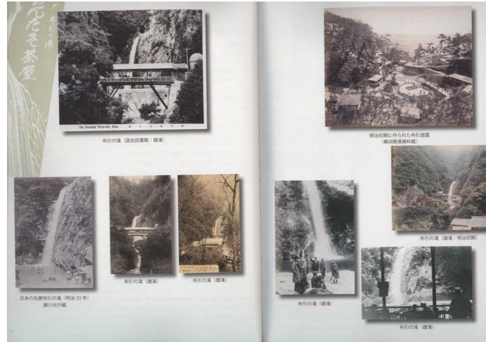
古絵図と写真集は時と共に変化しているのがよくわかる