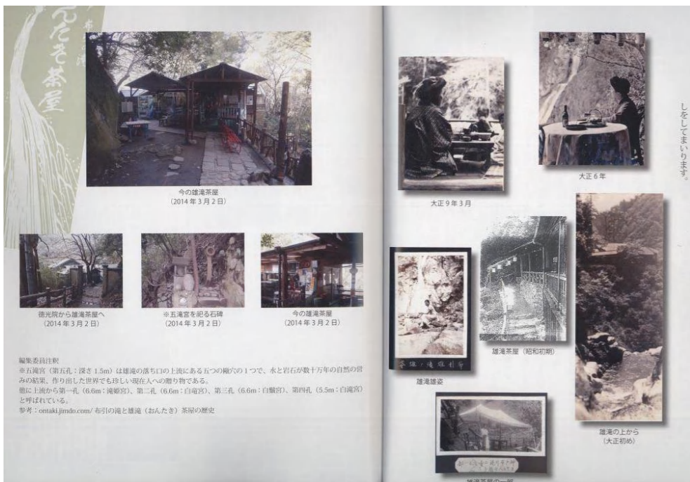
写真で見る雄滝茶屋の今と昔・昔の雰囲気もいいね