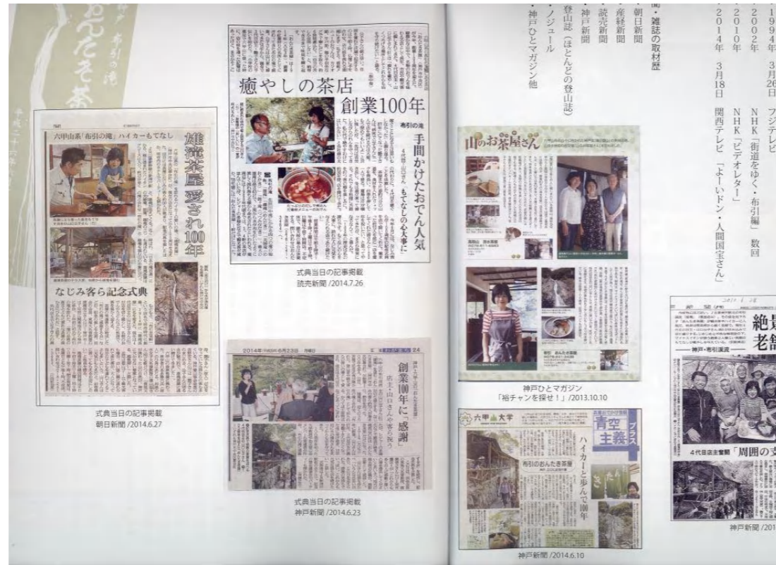
新聞・マスコミに取り上げられた雄滝茶屋