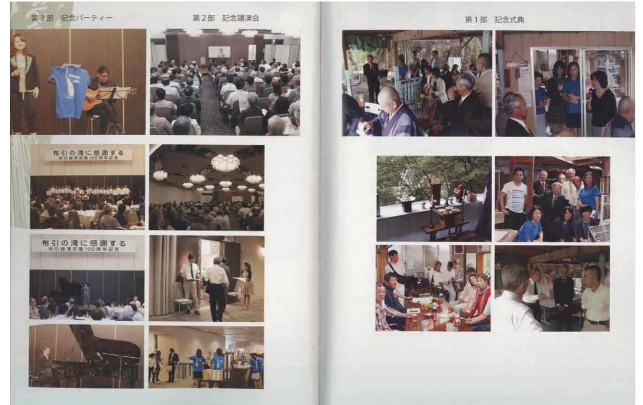
100周年記念式典の様相