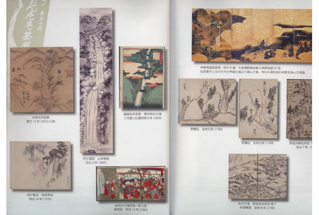
古絵図と写真集も夢があって面白い