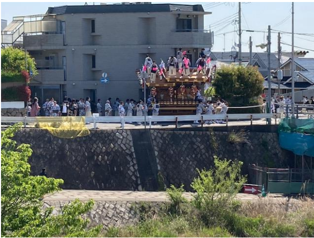
だんじり祭りの様子