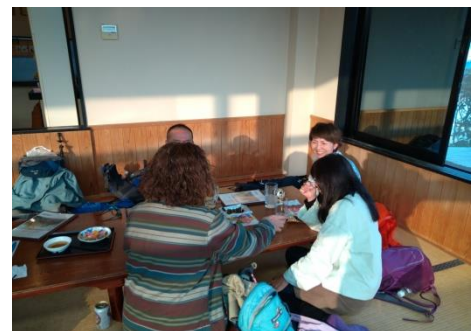
至福のひとときを楽しむ！メンバー