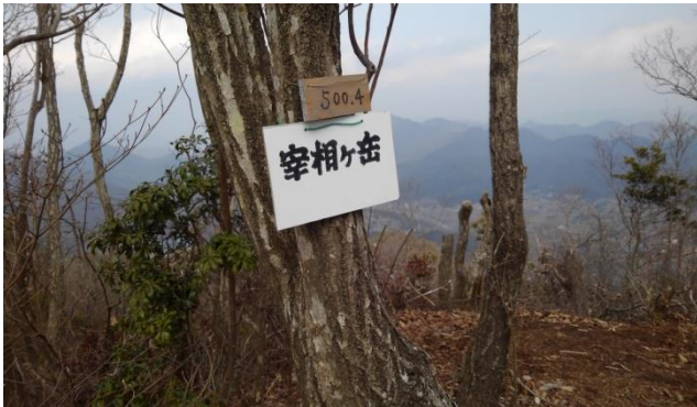
宰相ヶ岳（さいしょうがだけ）山頂にて

羽束山山頂にある神社の前で昼食をとり、三つ目の山、宰相ヶ岳（さいしょうがだけ）へ！・・・下りの登山道（獣道）？は、足元の大変悪い所もあったが、それでも何と楽しかったことか！・・・勿論、案内してくれている会長や先輩方がいてくれるからこそ楽しめているわけですが！・・・とにかく楽しい！気持ちいい！・・・そして、二つのお山をつないでいる鞍部？からキツイ急な登りを上がり切ったら宰相ヶ岳の頂上でした！！