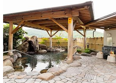
天然温泉・花山乃湯

そして、楽しみな温泉、花山乃湯へ！・・・下山から1時間近く歩いたけど楽しみしかなく、足取りも軽い！・・・