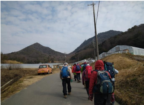
左のトンガリ山が宰相ヶ岳。右が羽束山で~す!

会長の説明を聞き、ローカルバス?に皆で乗車。お~!テンション上がる!・・・乗客は私達22名と他客は僅か3名。それでも満席、少し密??な状態で登山口へ!