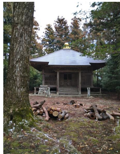
羽束山山頂にある観音堂

うん、大丈夫!行けるぞ!・・・次に羽束山!しんどいぞ!ちょっときついぞ!会話の余裕は全く無し・・・でも、登頂後の絶景はたまらん!気持ちいい!!!