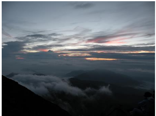
御前峰（標高 2702M）にてご来光を待つ。

昨日の登りの辛さや、今朝の息苦しかったことなど、すべてが吹っ飛んでしまいました・・・。