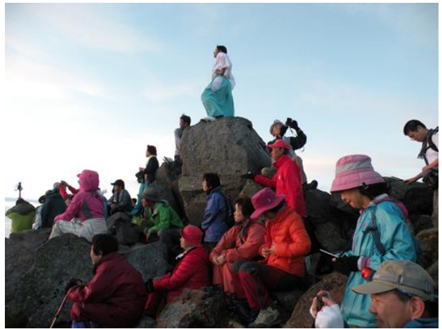
ご来光拝顔の為東の空を眺めるヒヨコのメンバー

室堂センターでの朝食時は、あちこちで笑顔の花盛り！皆さんも感激されたのでしょうか！