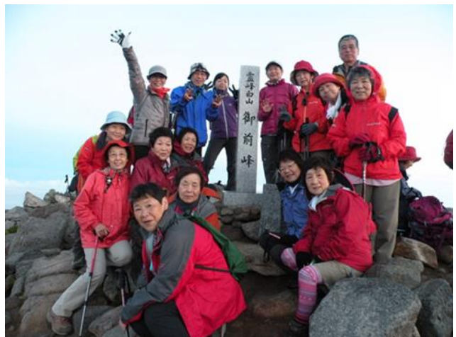
ご来光拝顔前にはいポーズ！！

室堂センターでの朝食時は、あちこちで笑顔の花盛り！皆さんも感激されたのでしょうか！