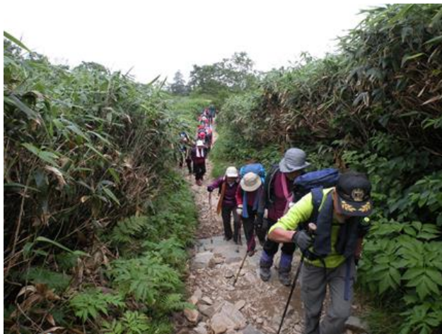
歩き始めはシンド～イ！・・・です！

吊り橋を渡りきるといよいよ砂防新道の登りにかかります。背中リュックが段々と肩に食い込み、重痛く、少しずつ目につきたした周囲の花を観る余裕も無く、やっと甚之助避難小屋に着いた時は「無理かも・・・」と、つい弱気になりました。