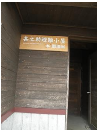
標高 1965M 地点にある甚之助避難小屋

南竜道分岐付近からはびっくりするくらい沢山の高山植物が花を咲かせて私達を迎えてくれました。ここから右方向へ行って、弥陀ヶ原を目