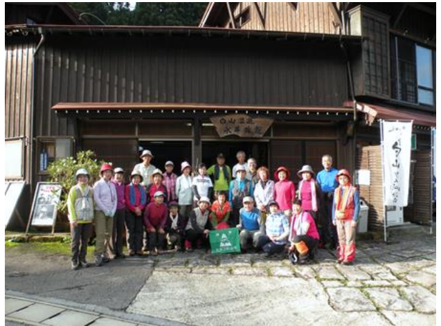
白山温泉・永井旅館玄関にて

翌朝はとても良い天気!!「やったー!さすがはヒヨコさんや〜!」。6時からの朝食をしか