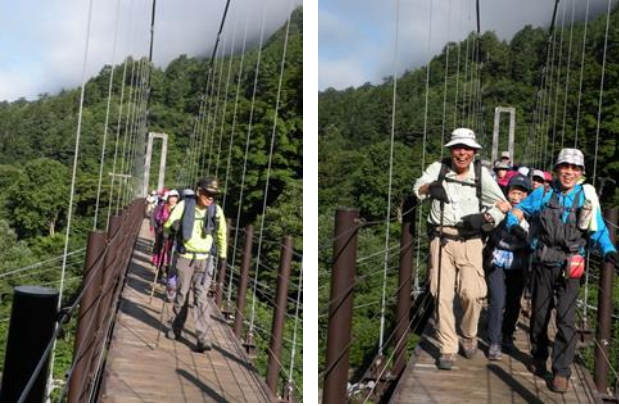
吊り橋だ～い好き！ 吊り橋だ～いキライ！

吊り橋を渡りきるといよいよ砂防新道の登りにかかります。背中リュックが段々と肩に食い込み、重痛く、少しずつ目につきたした周囲の花を観る余裕も無く、やっと甚之助避難小屋に着いた時は「無理かも・・・」と、つい弱気になりました。