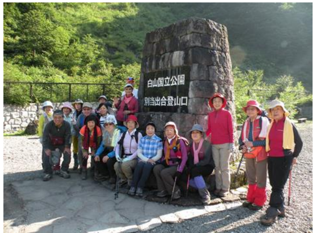
別当出合登山口(標高1260M)にて

り頂き、7時30分に迎えに来てくれた貸切バスに乗って登山口である「別当出合」へ出発。つづら折りの狭い道をぐんぐん登ります。周囲の木々も高山の原生林に変わり、高度感を楽しんで?いるうちに別当出合に着きました。