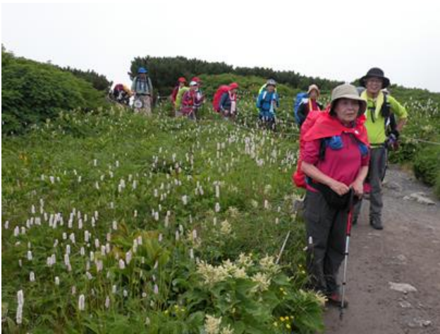
来たー！！室堂センター（標高 2450M） あ～しんどかった！！

架け橋の何と素晴らしかったこと！消灯後に眺めた夜空も、周囲の深い闇と輝く満点の星に、又々感動です！！