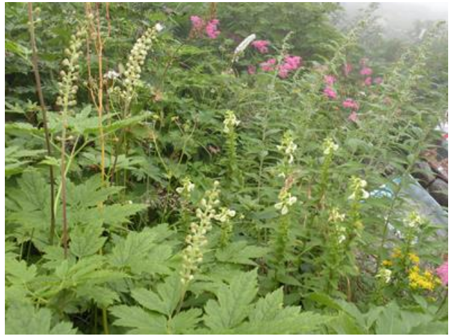
お花のオンパレード！

南竜道分岐付近からはびっくりするくらい沢山の高山植物が花を咲かせて私達を迎えてくれました。ここから右方向へ行って、弥陀ヶ原を目