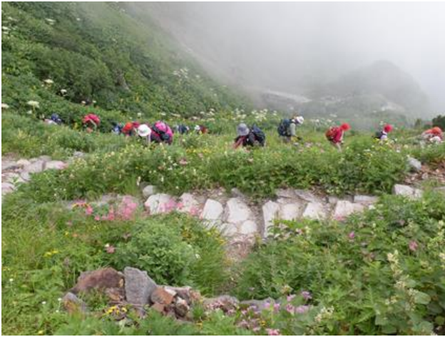
もう少しで黒ボコ岩（標高 2310M）。