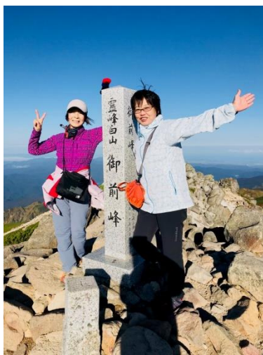
霊峰・白山の最高峰となる御前峰山頂 (標高 2702.14M の一等三角点有り)

弥陀ヶ原の木道歩きを終えゴロゴロと大きな岩が並ぶ五葉坂を登り、室堂に到着。ここでリュックをデポし、身一つで御前峰を目指しました。