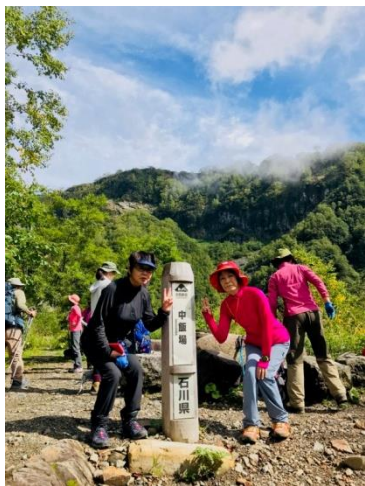
心ウキウキ！（中飯場にて休憩）

22 日早朝、先程まで降っていた雨がようやくあがった所で家を出発。大阪発のバスに乗車するまでは一滴の雨にも当たらず、幸先の良いスタートを切ったようであったが、出発して 30 分も経たないうちにバスは雨の中を走行していました。顔面がひきつり心も萎え出し、不安な気持ちで車窓を眺めていましたが、日本海の方に抜けると雨がやみ始め、白山登山口である別当出合に付く頃にはすっかり雨が上がって青空もちらちらと見え出しました。ラッキー！！