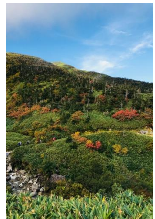
お泊りは南竜山荘です！すでに紅葉してました！

ヨっしゃー！！と込み上げる感情を抑えながら今晚泊まる山小屋・南竜山荘を目指しました。山荘に近づいてくると木道が延々と敷かれ、万才谷を流れる水が、勢いよく流れていました。白山は水が豊富と聞いていましたが、小屋ではウオシュレット付きの水洗トイレがあり、山小屋では初めての経験でした。