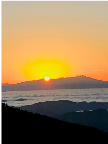
すばらしいご来光&雲海で～す！

東の山間から太陽が顔を出し始め、山の周りに雲海が立ち込め、山々が点在する島のようになり、見事な雲海とご来光！・・・テレビでしか見ることが無かった光景が目の前に現れ、感激！感激！又 感激！・・・でした。