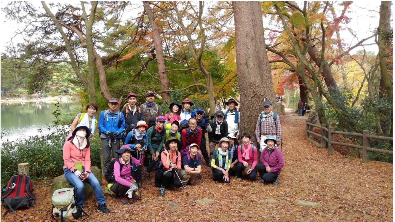
2020・11・29 修法ヶ原池のほとりにて

最後に、11月22日は「いい夫婦の日」だったので、帰りにポジョレー・ヌーヴォー(今年2本目)を購入し、奥さんときっちり飲み干し、何とか事なきを得ました。(笑)