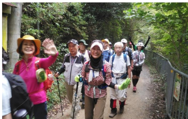
同 3班グループの中間を歩くお母さん??たち