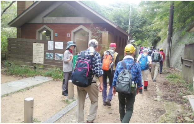
最後尾で〜す！・・ いってらっしゃ〜い！！