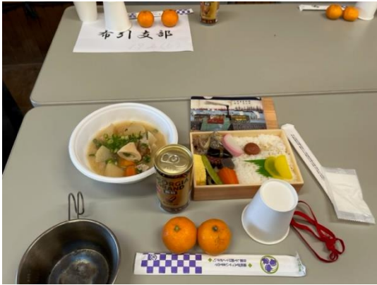
どなたのお席？具沢山豚汁、何杯お替りしたの？