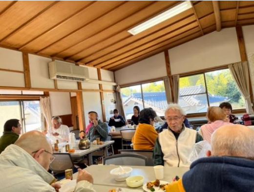
2階大広間は「懇親の場」として最高です！