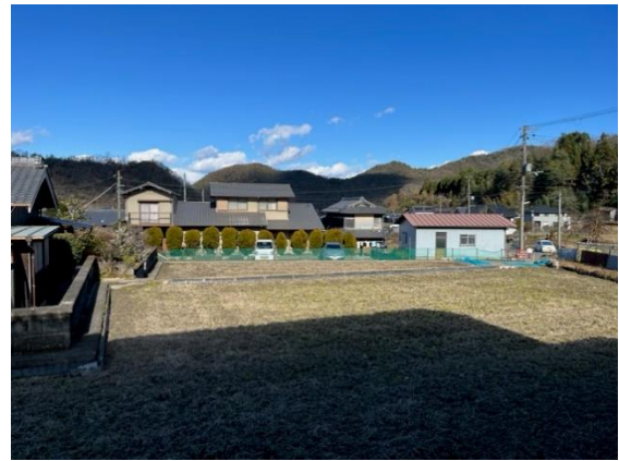
のどかな唐櫃の集落風景