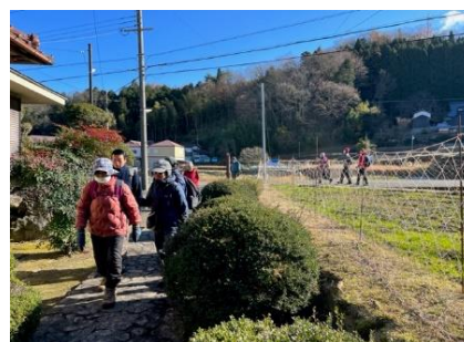
いざ懇親会 会場・組合会 館へ

・・・でしたが、豚汁賄い隊より連絡が入り、 豚汁が予定時間より早く出来る!!とのこと。 皆さん朝早くから有馬口まで来られているの で、予定より早くなるのは大歓迎!!だと言わ れるのは解っている(失礼!)ので急遽、ショ ートカット(文中の赤字部分)をし、組合会館 へ急ぐことにしました。