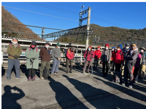
全支部から参加された皆さん

2022年(令和4年)最終例会のポスター そんな素晴らしい年の締めくくりと、迎える 新年をも早や祝うがごとく、雲一つ無く晴れ渡 った青空!! 神鉄有馬口駅南側駐車場に集合 された参加者は合計65名。