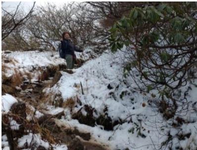
雪解けの登山道（山頂近く）

道は雪が解けてジュルジュルになっていてアイゼンはいりませんでした。13時過ぎ磐梯山山頂に到着。山頂には結構人がいました。記念撮影を終えて早速昼食にしました。山頂からは360度景色が見渡せ、南側には猪苗代湖が北側は湖沼群が綺麗に見えました。