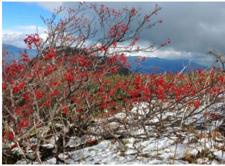
ナナカマドの紅葉

道は雪が解けてジュルジュルになっていてアイゼンはいりませんでした。13時過ぎ磐梯山山頂に到着。山頂には結構人がいました。記念撮影を終えて早速昼食にしました。山頂からは360度景色が見渡せ、南側には猪苗代湖が北側は湖沼群が綺麗に見えました。