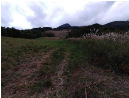
猪苗代スキー場から見た磐梯山

登山口の標識がありましたが、まだまだ車で行けそうなので「どこまで行けるのかな？」と恐る恐る登っていきました。もう少し、もう少しと進んで行くとスキー場のリフトの中継地点までできました。「この辺にとめようか」と駐車場所を探していたら、小屋から若いお兄ちゃんが出てきて「この辺は重機が通るので停めないでください」「下の駐車場にとめてください」と言われました。