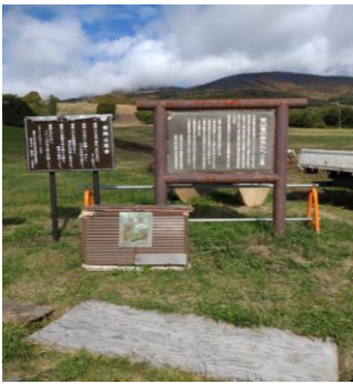
猪苗代登山口の看板

前日、星野リゾート磐梯山温泉ホテルに宿泊。夜も朝も美味しいものをたらふく食べて本日「宝の山」に登ろうとしています。朝8時のホテル出発予定が8時30分になり、本日の登山口「猪苗代登山口」には9時頃に到着。平日で駐車場にはほとんど車はありませんでした。