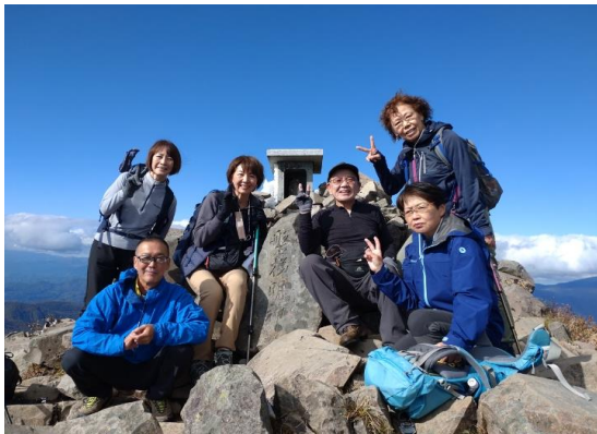
磐梯山山頂磐梯明神の前で