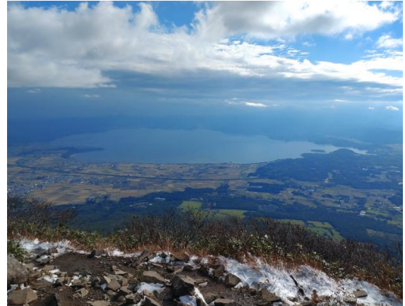
猪苗代湖（磐梯山頂より）

十分に景色も楽しみ、お腹もふくれたので下山の準備にかかります。下山は、登ってきた道を下ります。弘法清水小屋の横の湧き水で水を補給。登って来た道をひたすら下りました。