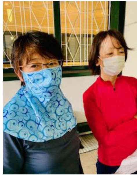
マスクのファッション ショー?

吉野会長による朝礼でスタート。今回のコースは、摩耶山地・その1「静かな地獄谷に涼気を求めて」の予定でありましたが、豪雨による山道の荒れや増水による渡渉不可などの懸念(我々の久しぶりの登山による体力の心配!?)があり、会長より「地獄谷に行きたい方手を上げて」の一声に誰一人として手は上がりずコース変更決定。新神戸駅～車道～ハーブ園入口～ハーブ園東尾根～縦走路出合～稲妻坂～555P(学校林道出合)～摩耶山に変更。