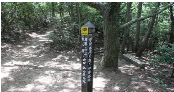
学校林道出合/ネット画像参考

もう少しと思ったが、ここが落とし穴。六甲山全山縦走で歩いたのにすっかり忘れていました。朝の会長の説明でもあったではないか！六甲山特有の南北に地層があると…。ここから一旦下り標高約 400mに戻るのである。縦走路出合で残り半分と言ってしまった。聞いていた人ごめんなさい。学校林道出合で約半分です。途中、日も差しましたが、涼しい風も吹いていました。