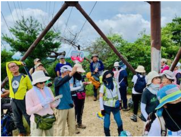
ハーブ園東尾根から先の高圧線下にて

な階段があり少々ペースダウン。ハーブ園山頂駅横を抜けて縦走路出合に到着。思ったほど疲れはなく一息入れた。ここから稲妻坂を登り学校林道出合（標高 555m）に到着。摩耶山頂が 702mなので残り 145m。