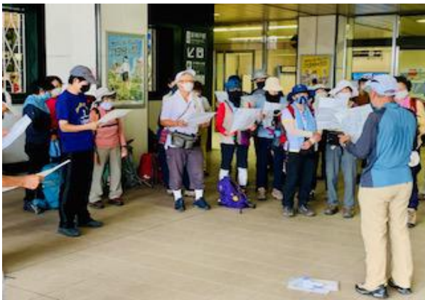
久しぶりの例会集合風景・・・新神戸にて

コロナウィルスによる影響で、ヒヨコの例会も2月23日の「ヒヨコ3分割・その2」以降、全て中止になっていた。6月28日より再開予定も、今年の梅雨は例年になく雨が多く、再開1回目は早朝より雨で、川の増水による危険回避のため中止になった。その後も雨の日が多く各地で豪雨による被害が発生し、7月8日には神戸市にも大雨警報・洪水警報が発令された。九州地方では、災害により亡くなられた方や被災された方が多く、ご冥福及びお見舞い申し上げます。