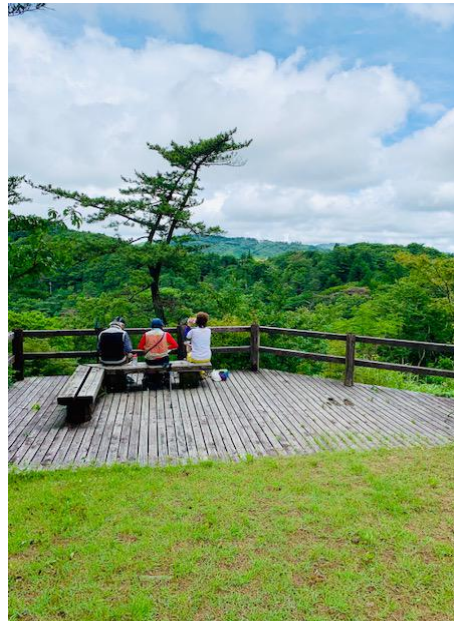
素敵なテラスで昼食を！（絵になるね～！）

とする)前進。そして看板のある尾根に出たが、ここは騙されない。まだ頂上ではないと記憶している。平坦な道の後にまた上りがあるので覚えているので、大丈夫。岩場に再度入り最後は階段。これが結構辛い。途中でショートカットし電波塔のある頂上に着いた。途中お腹が空いてグーと鳴ったが、時間は 12 時を過ぎていた。腹時計は、結構正確です!!