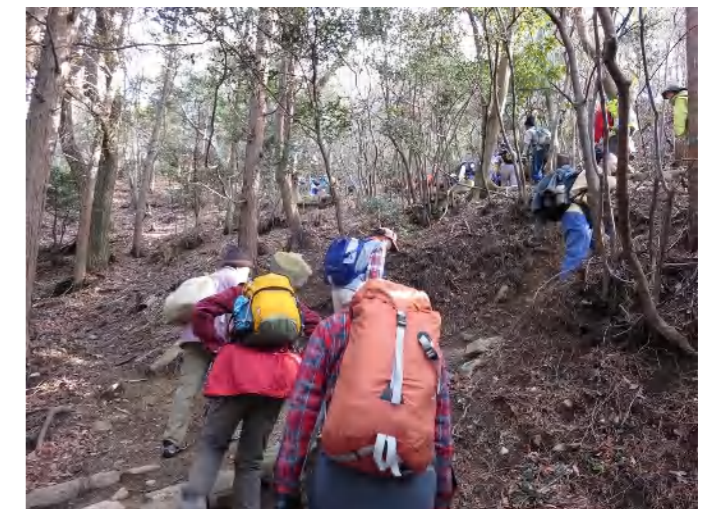
市ヶ原から摩耶山への登りはゆっくりとしたペースで3つのピークを越えて摩耶山・掬星台へ