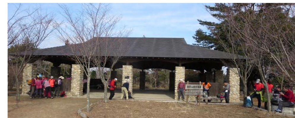
掬星台で休憩をとった後は丁字ヶ辻、記念碑台まで歩き昼食