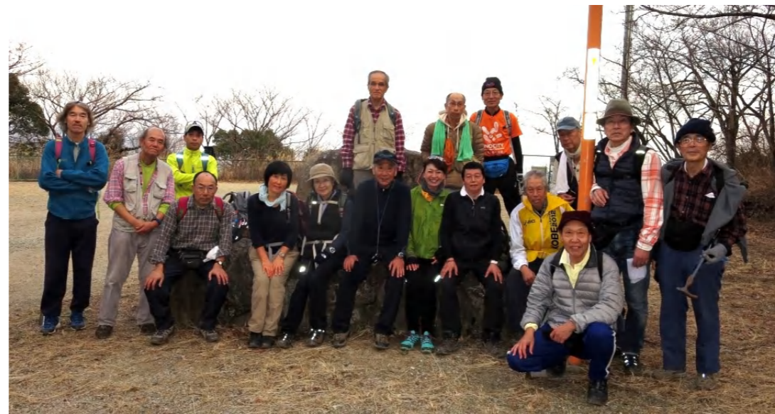
午後 4 時半ごろに全縦組は 18 名がゴール、半縦組はそれより約 40 分遅れでゴールしたとのこと、お疲れ様でした