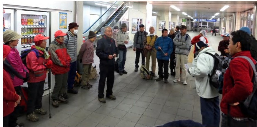
43名の参加者は新神戸駅に午前8時の集合し例会委員長、会長から注意事項があり、ストレッチ運動を行ってスタート