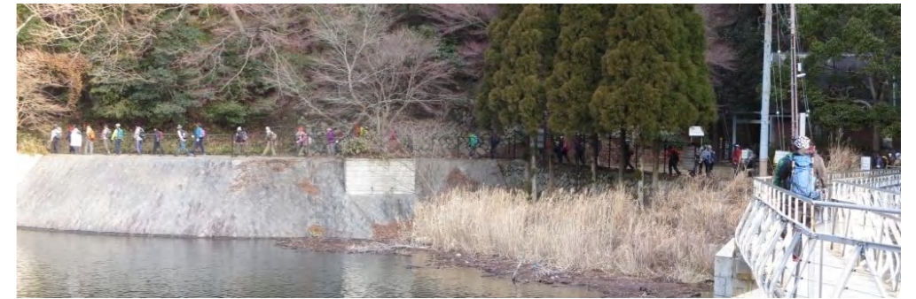
今日は晴天に恵まれ、布引貯水池は満面の水をたたえ、右岸の放水路としての新滝からは、このところ雨がも多く勢いよく流れ落ちていた