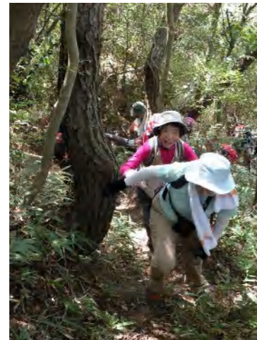
アップダウンの繰り返しにも余裕の笑顔！