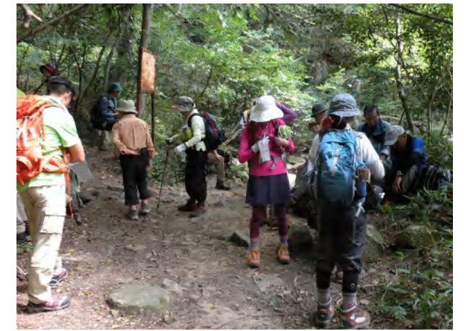
桜谷出合いで一休み 新穂高へ入ると、多数が一度に食事休憩を取る場所が無い為、ここで軽い食べ物を補給しました