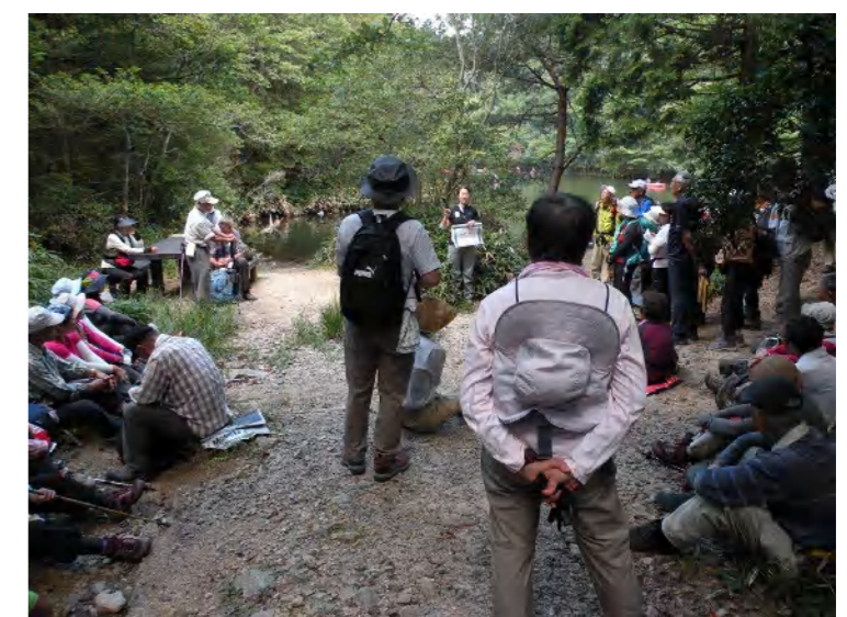
参加された環境省神戸保護官事務所アクティブレンジャーから「瀬戸内海国立公園・六甲山地）について、詳しい説明をして頂きました。