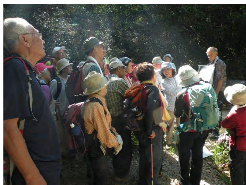
自然保護委員長による「ハイイロチョッキリ」の生態説明に聞き入る参加者の皆さん