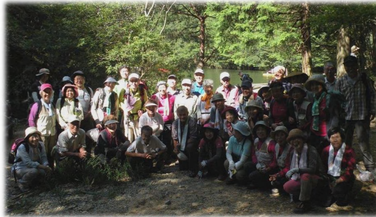
穂高湖のほとりに集合 47名もの参加者 最後まで和気あいあいでした！