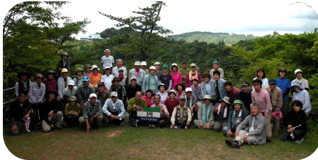
参加者全員集合！ バックには摩耶山天上寺の屋根が見えます！

昼食後、吉野岳連自然保護委員長より、今が見頃の「テイカカズラ」についての説明があり、参加者の皆さんは熱心に聞き入っておられました。