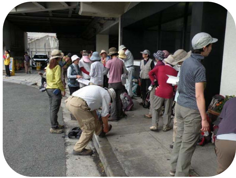
新神戸駅1階へ続々集まって来られた参加の皆さん