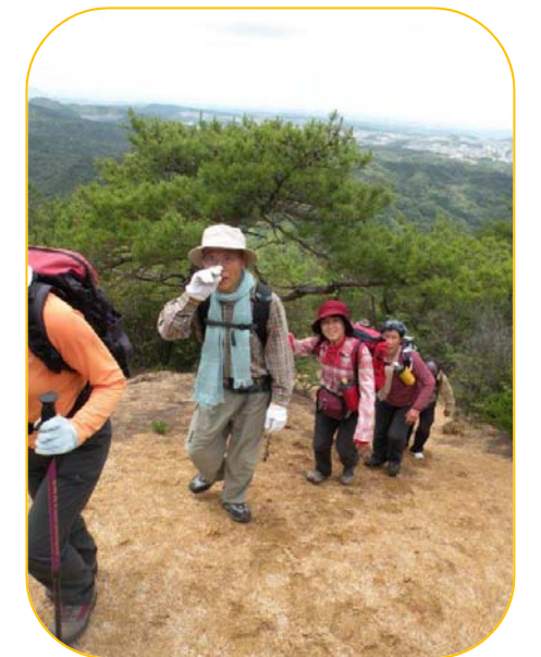
やっと安心！笑顔がこぼれます！