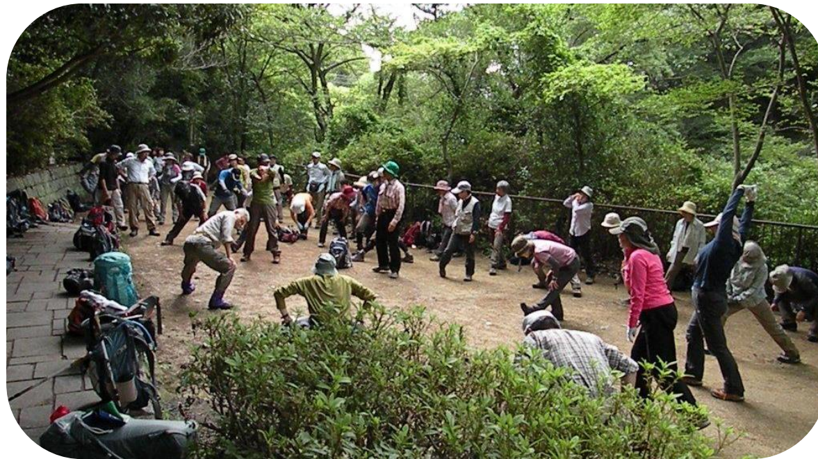
布引公園にて先ずは準備体操です！