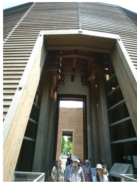
「木の殿堂」の入口付近

楽しみにしていた山菜料理の昼食は、ハチ北高原にある「ちさと山荘」で。私達が少し早く着いたため、厨房は大忙し！・・頂く側がもう少し落ち着いてほしい・・と思ったぐらい、皆さんお腹が減っていたのでしょうか？・・・(笑い！)