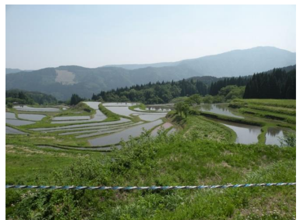
氷ノ山をバックにした美しい棚田

食後はすぐ近くにある別宮(べっくう)の棚田へ。標高700メートルから眺めた日本の原風景は、今まさに田植えを終えたばかりで、田の水の煌めきと、畔の緑、そして青空を携えた氷ノ山をバックにしたすばらしいものでした！