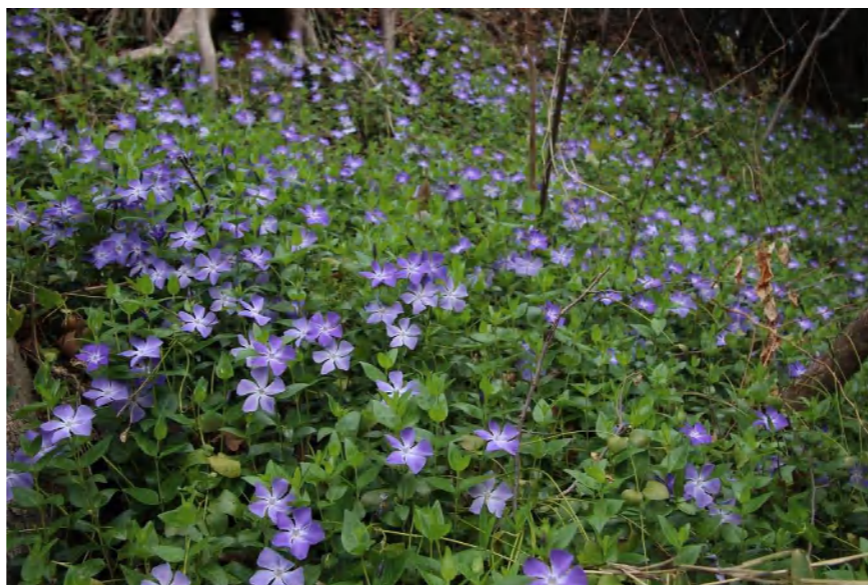
ツルニチニチソウも長期間楽しませてくれる