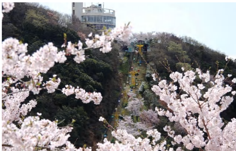
鉢伏山とリフトは子供に人気