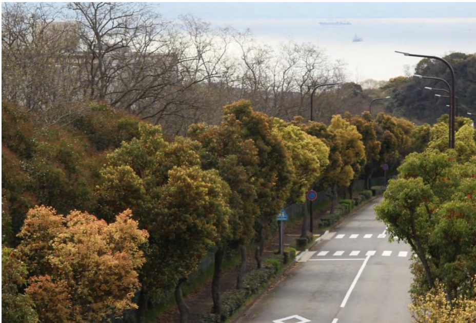
楠は芽吹く春先が美しい