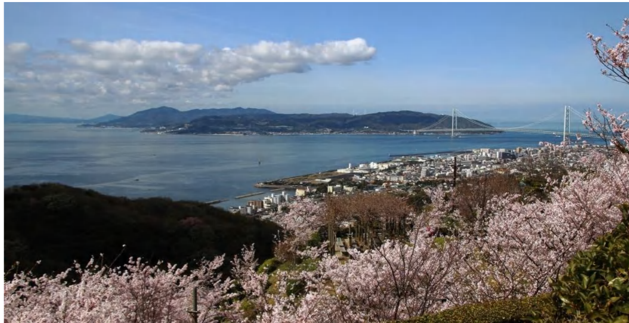
明石大橋に映える桜は絶品