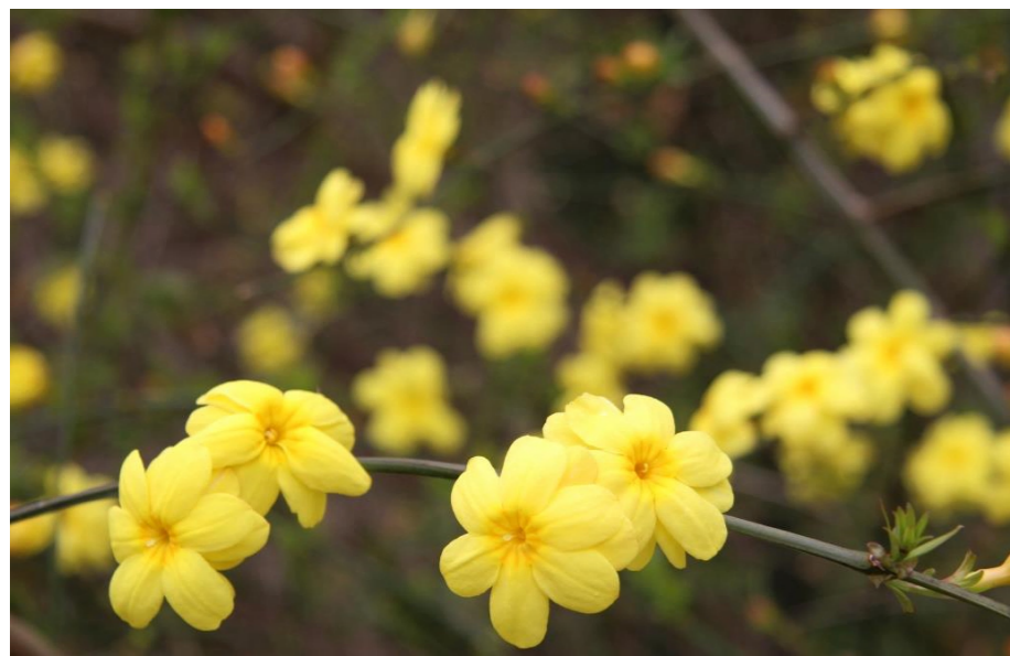
見かける黄梅花も年々立派な花をつける