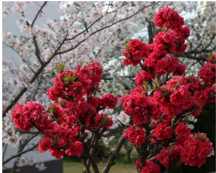
高倉団地内で見つける花桃はいつも愛らしい