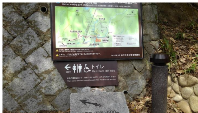
三か国語で示された新トイレ案内表示板

尚、滝見物に訪れた観光客の非常用として雄滝茶屋からすぐの場所に男女兼用バリアフリートイレが設置の工事に入っており、7月末完成を目標に工事を行って下さっています。（吉野 記）