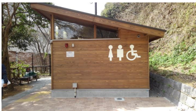
男女共広々とした新バリアフリートイレが完成

阪神間ハイキングコースのランクNo1 といえば「芦屋ロックガーデンコース」と、誰もが言われるかもしれませんが、神戸市民にとってのハイキングコースランク No 1 といえば何といても、私達布引支部会員が朝な夕なに歩き、そして及ばずながら、登山道清掃や周辺管理のお手伝いをしている「布引山筋ハイキングコース」です。本コースには日本三大神瀧の一つ、布引の瀧群を抱えており、ハイカーのみならず、国内外から訪れる観光客にも超人気の場所なのです。