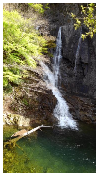
五本松かくれ滝（旧称・浅見の滝）

北野町と布引ハーブ園を結んでいる布引 ロープウェイを真上に見ながら進み、布 引溪谷を跨いでいる「谷川橋（重要文化財）」 を渡って進むと、正面に布引ダム（貯水池） が見え、右側には滝が見えるが「五本松 かくれ滝」の名称で呼ばれている。私がヒ ヨコに入会し、早朝登山に精を出していた 頃、大先輩達は