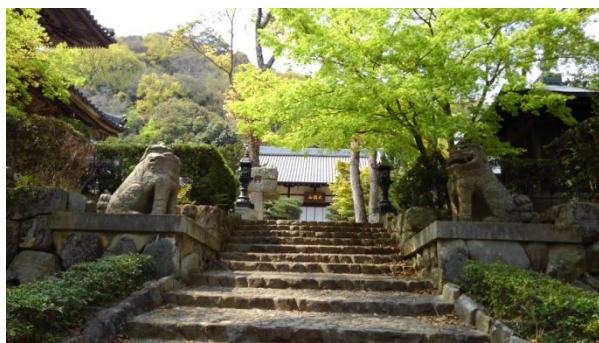
川崎財閥の創始者が建てた布引徳光院（禅寺）

本来ならば開催して楽しい思い出を刻 んで頂けたであろう例会の大半を、中止 又は延期にせざるを得なくなった為、参 加を予定されておられた皆さんは大変残 念な思いをされておられることだろう。 年間で一番爽やかな季節 と言うのに・・・