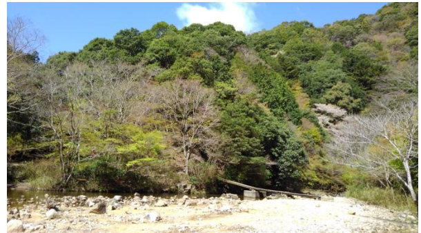
上・市ヶ原の河原の風景

桜茶屋（主が亡くなって後、偶にしか開かぬ）から河原へ降りると再度山方面からの出会いとなる。ハイカーのいない河原はヤケに広く感じられ、河原の白さ、鮮やかな黄緑の木々、それに真っ青な空のコントラストがなんとも美しい！！・・コロナなんて何処の国の話？・・と一瞬思うほど静かで美しい風景だ。