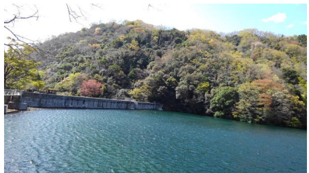
「涅槃像尾根」・・・と呼ばれていた城山方面

貯水池の左岸側から城山方面を見ると、昔は木々も背丈がそんなに高くなかったので、稜線全体のスタイルが、観音様の寝姿にそっくりであったため「涅槃像尾根」などと呼ばれていたのを記憶に留めている。しかし今は、どう見てもその面影を感じることは出来ない。