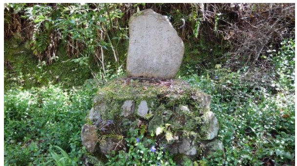
創立10周年記念として贈られた桜の苗木を記す記念碑

水道施設の分水隊道を横に見て、北側入口に出る手前に大層な記念碑が目に入ることだろう。これはすぐ先にある紅葉茶屋を起点として活動していた「養気登山會」という会の創立10周年を記念して、昭和12年6月に神戸市が桜の苗木200株を寄贈した記念のもので、貯水池畔の手入れ等に尽力していた会を讃えたのであろう。それにしても大層なものを作ったものだ。