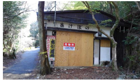
懐かしい「あけぼの茶屋」

市ヶ原の手前にあった「あけぼの茶屋」は随分前に閉店し、最近不動産屋の売り物件となっている。昔はここでよく飲ませて頂いた。イチロー選手が恩師と仰ぐオリックス時代の仰木監督と出会い、数度ビールとおでんでご一緒させて頂いたのも懐かしい思い出。