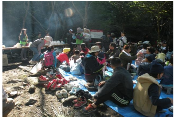
講師の説明に聞き入る参加者

コース誘導、植物の観察・昆虫や市ヶ原の河原の生き物の説明、葉っぱやどんぐりの工作、そして市ヶ原での豚汁の振舞いなど、高取支部より 3 名の応援を得てヒヨコ布引支部がサポートをしました。行動計画やレクチャー、そして豚汁シェフはお手の物！時間通りに事が運び、11 時 40 分より昼食開始となりました。