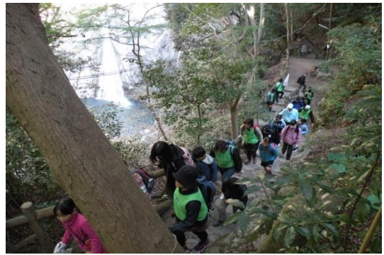
雄滝からみはらし台へ

コース誘導、植物の観察・昆虫や市ヶ原の河原の生き物の説明、葉っぱやどんぐりの工作、そして市ヶ原での豚汁の振舞いなど、高取支部より 3 名の応援を得てヒヨコ布引支部がサポートをしました。行動計画やレクチャー、そして豚汁シェフはお手の物！時間通りに事が運び、11 時 40 分より昼食開始となりました。