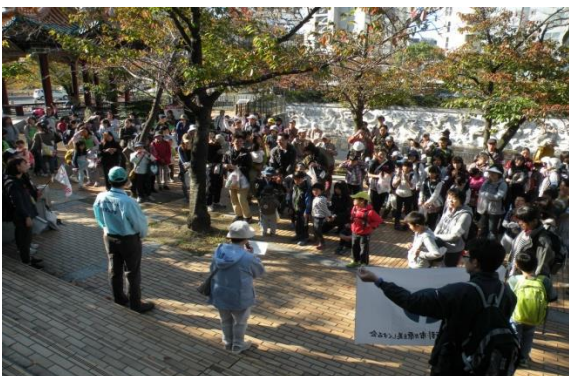
生田川公園に集まった 225 名もの参加者

布引・市ヶ原を美しくする会（中央区役所に事務所を置き街づくり推進課が支援）は、旧葺合区の小・中学校 P T A、子供会、婦人会、登山会で構成され昭和 54 年 5 月に発足しました。目的は 市民の財産である布引・市ヶ原の自然を市民の手で守り、育てるとともに、自然とのふれあいの中で、青少年の健全育成を図る ことです。春の桜まつり、夏の川であそぼう（兼生田川の清掃）に加え、秋には山で遊ぼうが計画実施されています。今年度は 11 月 3 日（祝）に行われました。