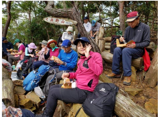
満腹、満腹！ 満足、満足！！

さあ～、うれしい昼食タイムだ！・・・ お腹もすいていたので、とても美味しく頂き、男性達が背負ってきて下さったお湯で、コーヒーまで飲むことが出来て、最高に幸せなひと時でした！！（感謝、感激です！有難う！）