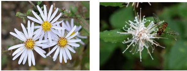
左・ノコンギク 右・コウヤボウキ（ネット画像）

七兵衛山に向かう。途中コウヤボウキやノコンギクが咲き、心穏やかな気持ちになる。又、もう少しすれば食べ頃になるムベを見つけて喜ぶ。