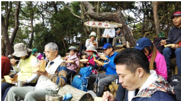
一心不乱！・・・お弁当に集中で～す！

最後の登りを頑張ると、七兵衛山頂に着く。どなたが作られたのか、丸太のベンチが沢山有り、大勢の人たちが座れて助かります。景色も最高でお弁当タイムには最良の場所です！！