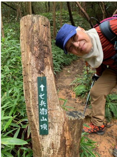
おたく様、七兵衛じいじ・・・ですか？

昨日の雨で足元が少し濡れているので、注意しながら少し長い山道を登って行くと、シロバナウンゼンツツジの群生が広がっています。春に花を付ける頃にもう一度来てみたい！！